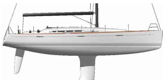
Grand tirant d'eau