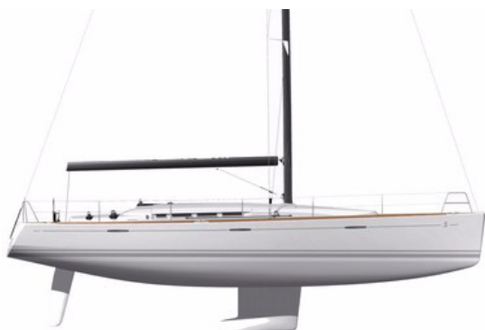
Très petit tirant d'eau