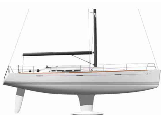
Petit tirant d'eau