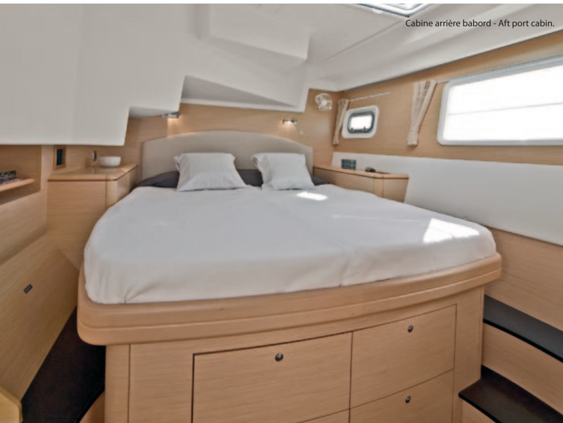
Cabine arrière babord - Aft port cabin.