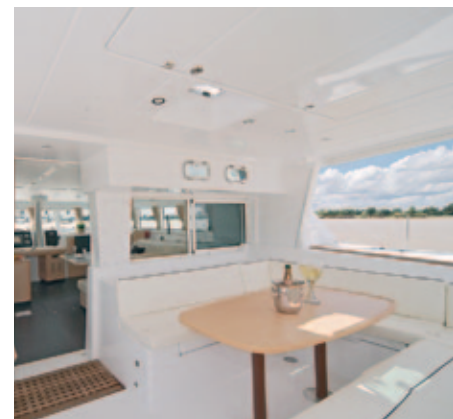
09 - 10