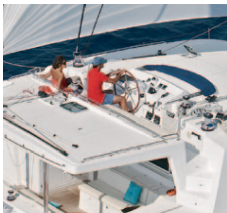
04 - 05