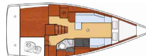
Week Ender - Transformable 2 cabines*