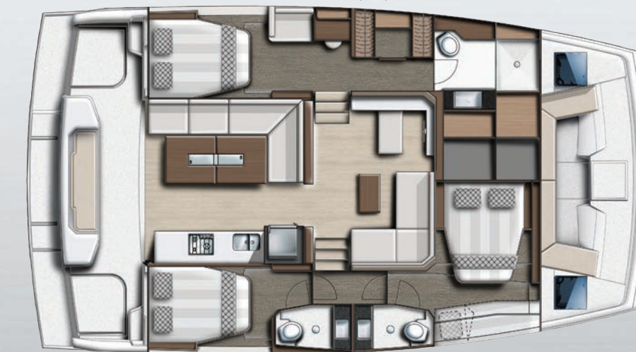
4 cabins family version Version 4 cabines family