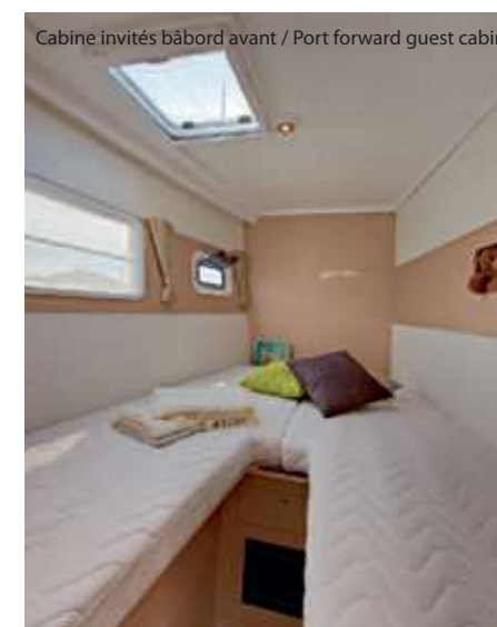
Cabine invités bâbord avant / Port forward guest cabin.