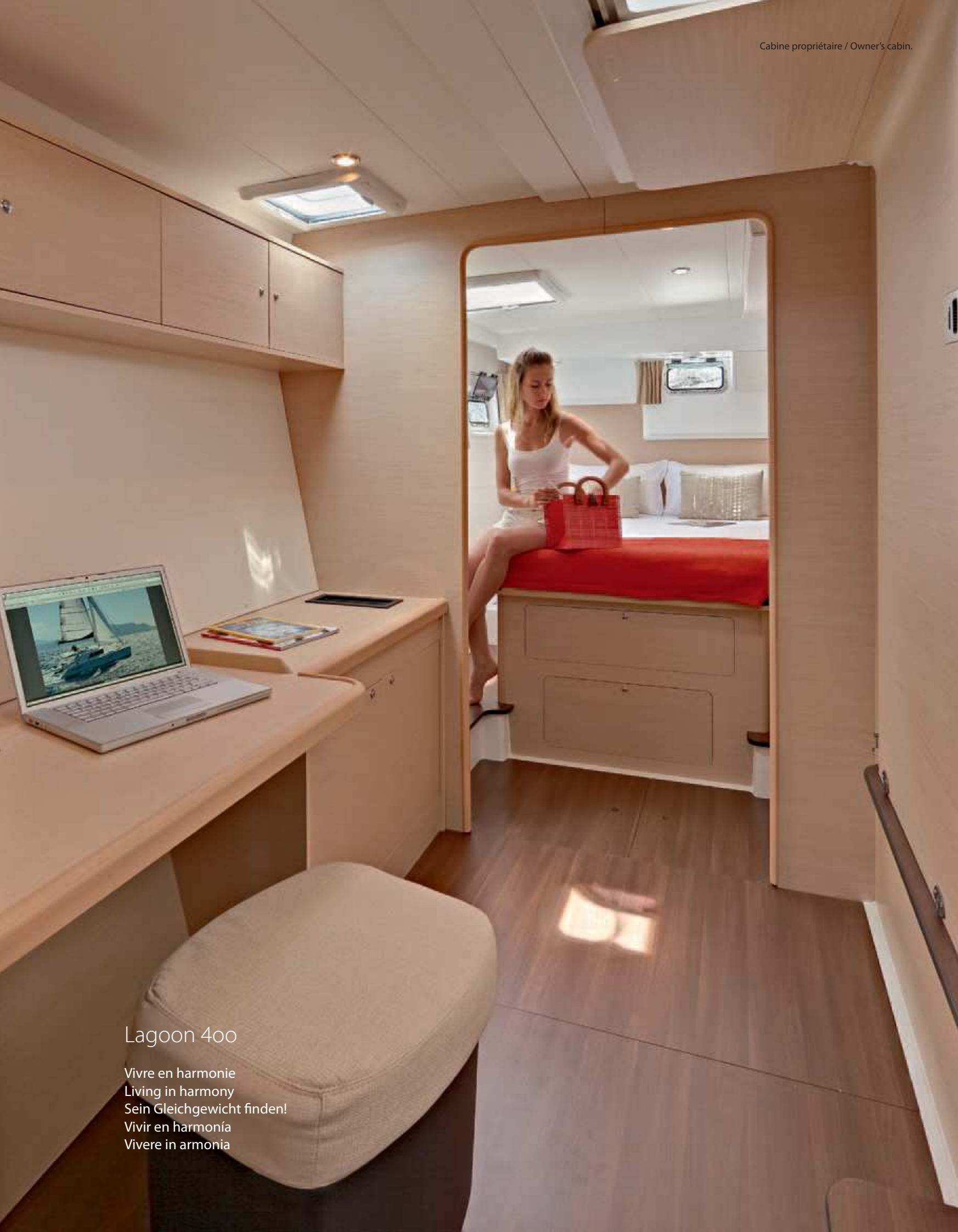
Cabine propriétaire / Owner's cabin.